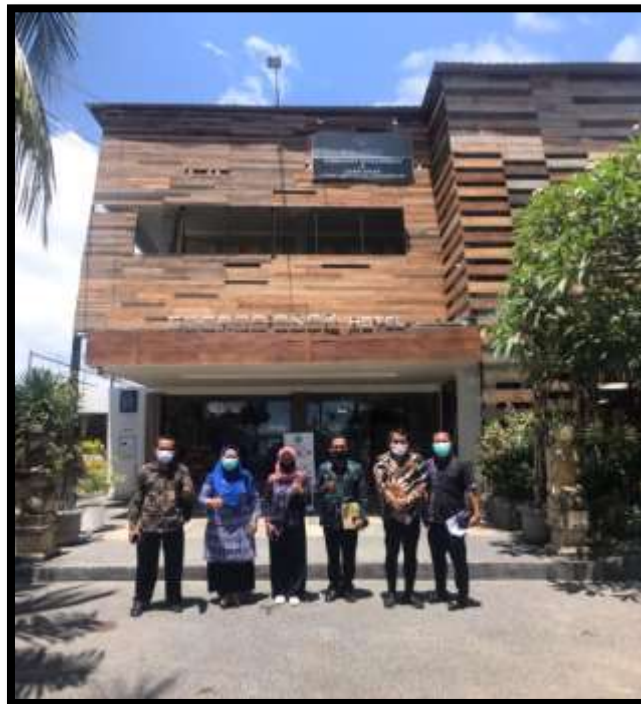
Gambar 4.4 Foto bersama anggota tim TNA didepan salah satu hotel di KEK Mandalika