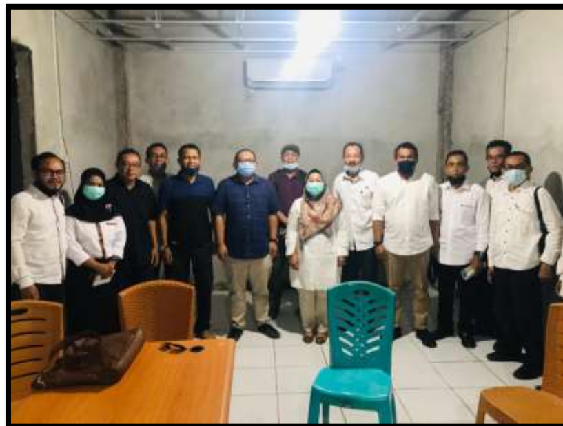
Gambar 4.6 Foto bersama setelah berdiskusi dengan PT. Casa Bayo