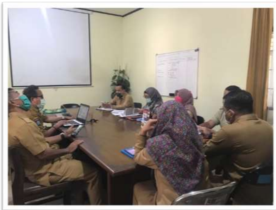
Gambar 4.1 Rapat Tim membahas isu dan permasalahan terkait dengan potensi penyerapan tenaga kerja lokal di KEK Mandalika.