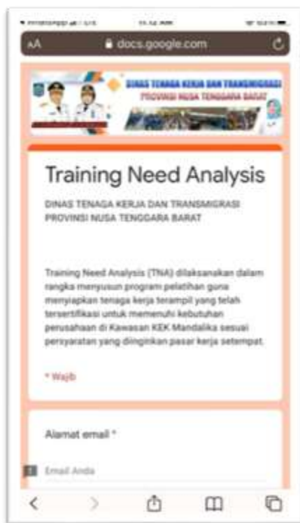
Gambar 4.2 Questioner dengan Google Form dalam rangka mengumpulkan informasi kebutuhan jenis jabatan di hospitality industry KEK Mandalika