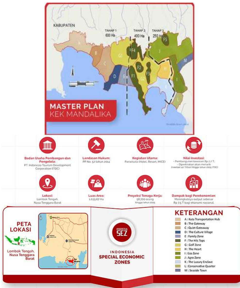
Gambar 2.1 : Grand Plan Pembangunan KEK Mandalika (sumber: https://kek.go.id/kawasan/Mandalika )

Terletak di bagian Selatan Pulau Lombok, KEK Mandalika ditetapkan melalui Peraturan Pemerintah Nomor 52 Tahun 2014 untuk menjadi KEK Pariwisata. Dengan luas area sebesar 1.035,67 Ha dan menghadap Samudera Hindia, KEK Mandalika diharapkan dapat mengakselerasi sektor pariwisata Provinsi Nusa Tenggara Barat yang sangat potensial.