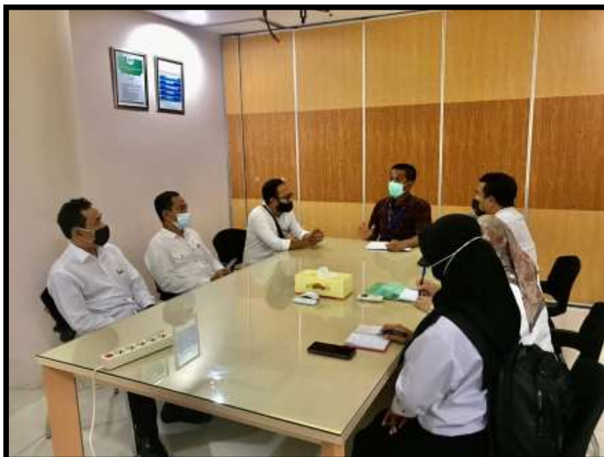
Gambar 4.8 Rapat antara tim TNA dengan Pihak ITDC untuk menggali informasi mengenai potensi penyerapan tenaga kerja lokal di KEK Mandalika