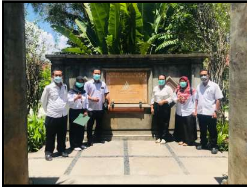
Gambar 4.5 Pose bersama Tim TNA dengan Manager Puri Rinjani Hotel