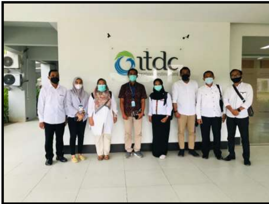
Gambar 4.7 Foto bersama tim TNA dengan Kadiv. Operasional PT. ITDC