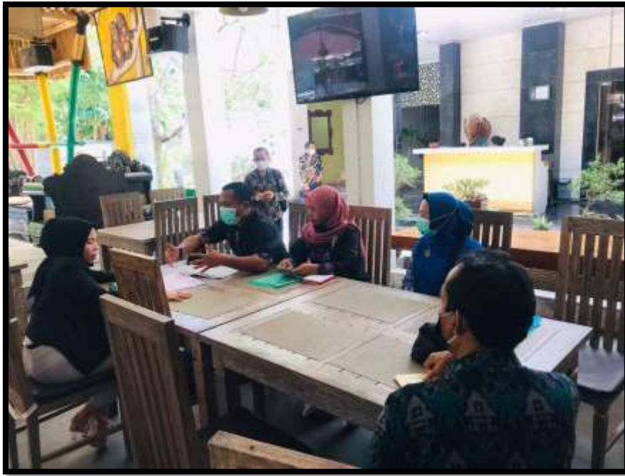
Gambar 4.3 Wawancara antara Tim TNA dengan Manager JM Hotel