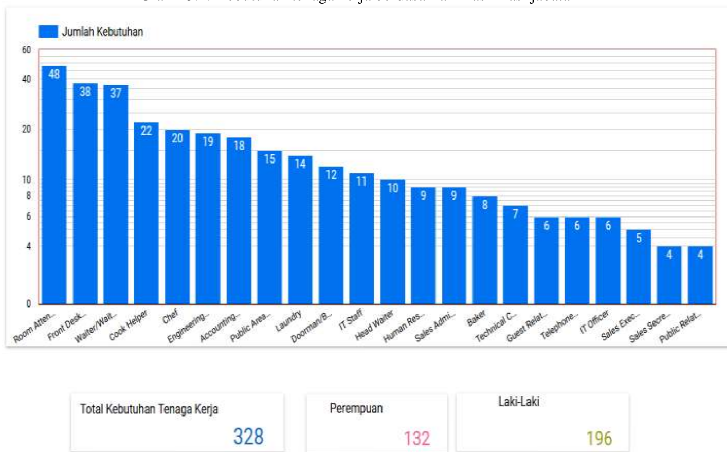
Grafik 3.1. Kebutuhan tenaga kerja berdasarkan klasifikasi jabatan